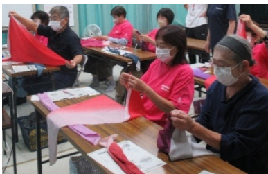
南勢地区での研修会