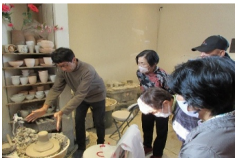
〈ろくろの手の使い方〉

当社協では介護者のつどいを毎年2回開催しております。今年度の第2回介護者のつどいは3月頃を予定しておりますので、よろしければぜひご参加ください。