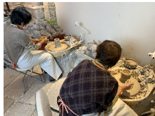
〈仲良く熱心に陶芸〉