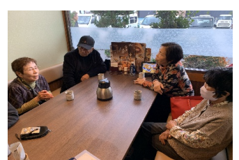
〈懇談会のひととき〉