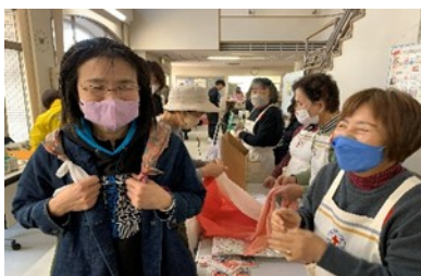
福祉ふれあい広場での活動

令和7年10月20日（月）に南勢・南島地区の両会場にて、日本赤十字社三重県支部より講師を招き、「災害時における高齢者支援」と「被災地での地域奉仕団の役割」を学びました。