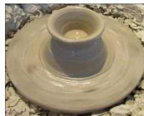
〈参加者さんの作品〉